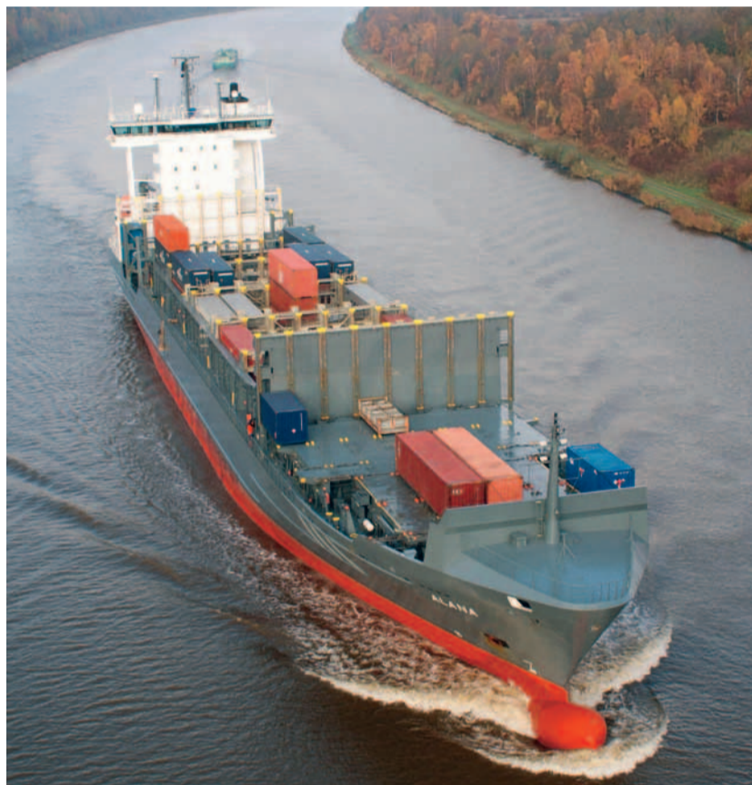
Der Seetransport in Nord- und Ostsee wird sich 2015 deutlich verteuern, wenn die Schiffe fast schwefelfreien Treibstoff tanken müssen.

Flüssiges Erdgas (LNG) wird als alternativer Energieträger in Zukunft eine große Rolle spielen, ist Oskar Levander von der finnischen Wärtilä-Werft sicher. Der Auftrag der Viking Line für ein Fährschiff mit LNG-An-